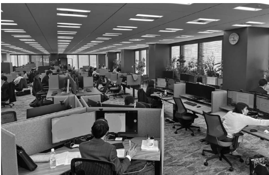
〈写真1〉丸の内オフィスのフリーアドレスエリア

首都圏の分散拠点の勤務者は、①週に一回以上は丸の内でも勤務する、②前日に利用した執務席は利用できない、というルールがあります。