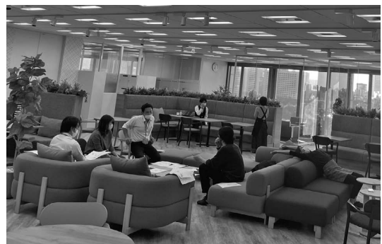
〈写真2〉丸の内オフィスの化学反応エリア

顔を合わせると、つながりが生まれて、化学反応が起きて、ひらめきやアイデア、新しいプランや文化が誕生する、それが…創英の化学反応エリアです。