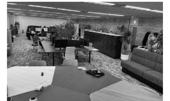
新宿新都心の一角にある超高層ビル(新宿野村ビル)にて開所しました。JR、私鉄、地下鉄各線の駅から徒歩10分以内で通勤できます。